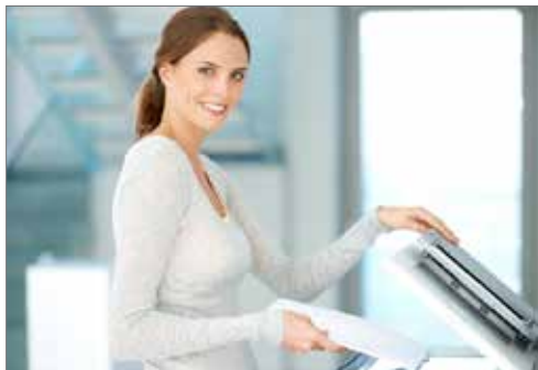
DOKUMENT &amp; UTSKRIFTER