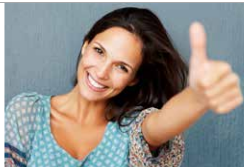
IT &amp; INFRASTRUKTUR