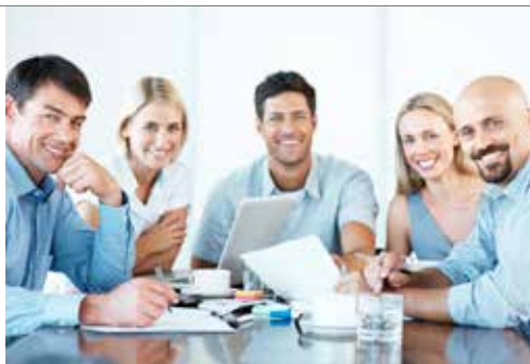
PRESENTATION &amp; MÖTEN